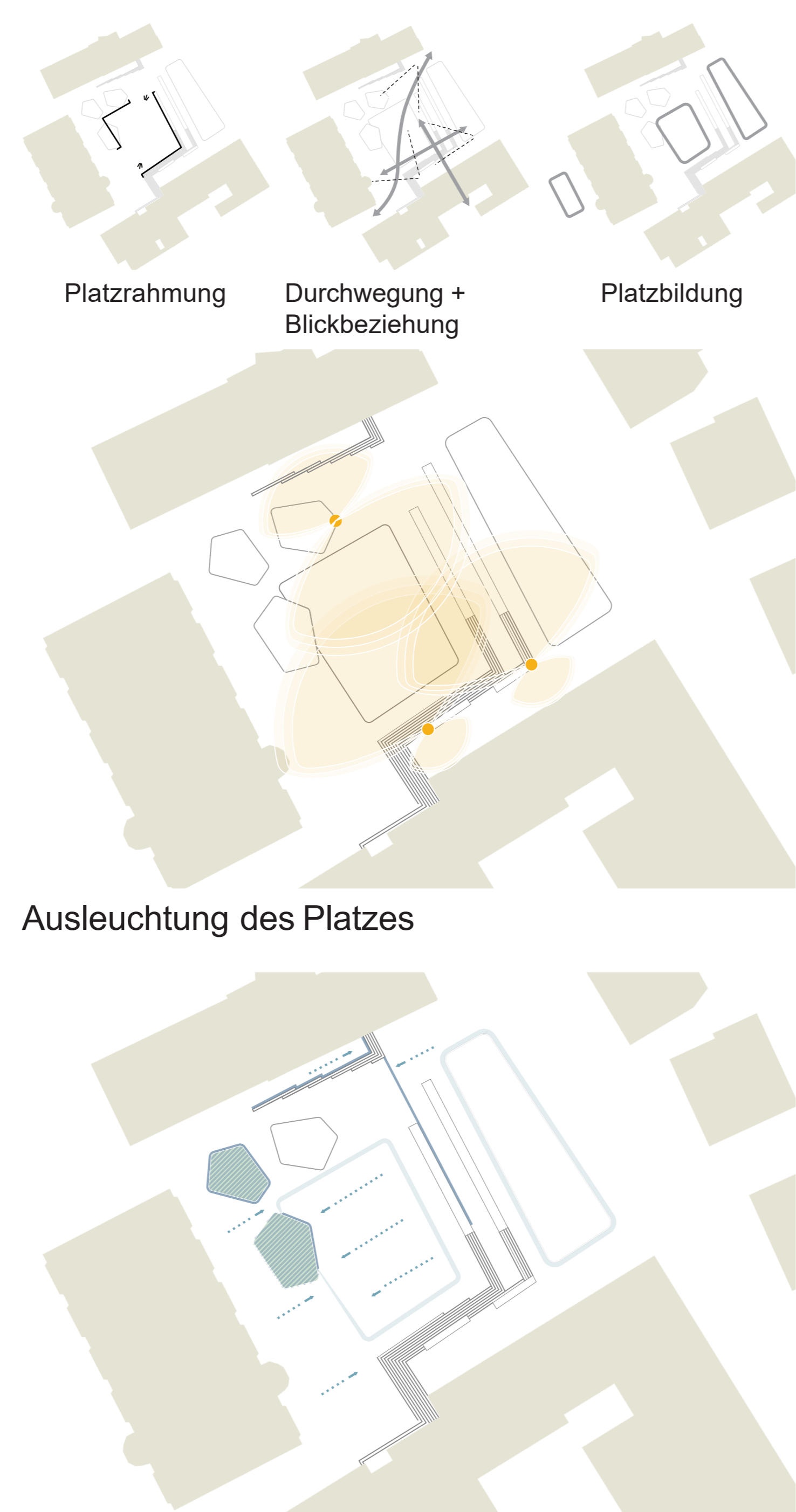
Entwässerung des Platzes